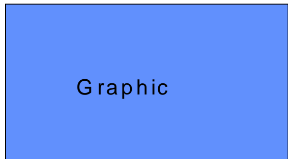
Abbildung 3: Graphik